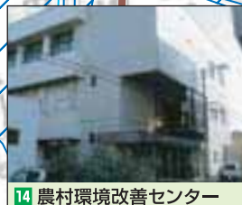
14 農村環境改善センター