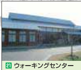
21 ウォーキングセンター