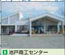
6 池戸商工センター