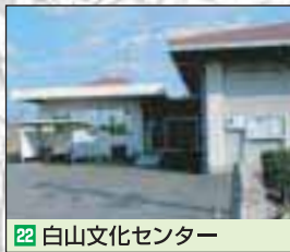
22 白山文化センター