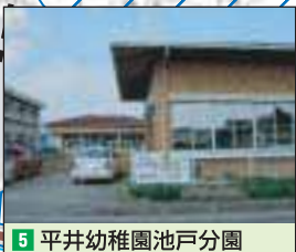
5 平井幼稚園池戸分園