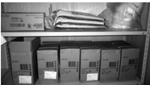
▲防災倉庫内の資機材

防災倉庫にある資機材の取り扱い説明は、より効果的に体験・習得等してもらうため、地域の自主防災組織が取り組む訓練の中で地元の消防団員を交え、実際に資機材を使いながら取り扱い方法等を説明していきたいと考えている。