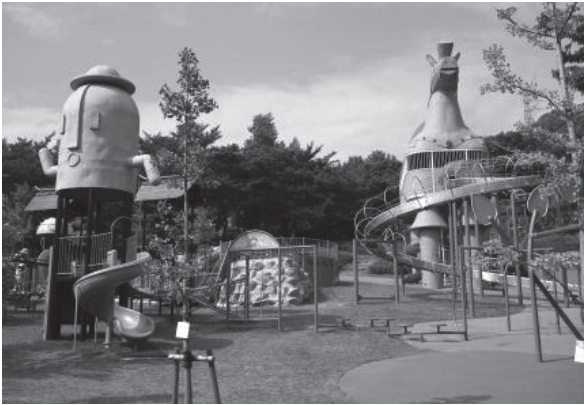
▲高松市・峰山公園『はにわっ子広場』の遊具