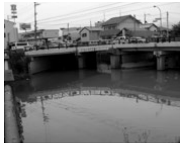
▲新川と古川の合流点