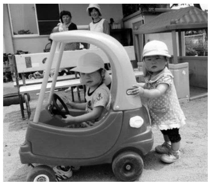
▲子どもたちはまちのたからもの（下高岡保育所）

ホテルの生息地を巡る提案については、町観光協会が各地区の組織に対し、イベント開催への助成を行っており、この中にホテルの養殖、保護、自然環境の管理も含まれており今後、地元の状況、意向も十分把握し協議を行う必要がある。