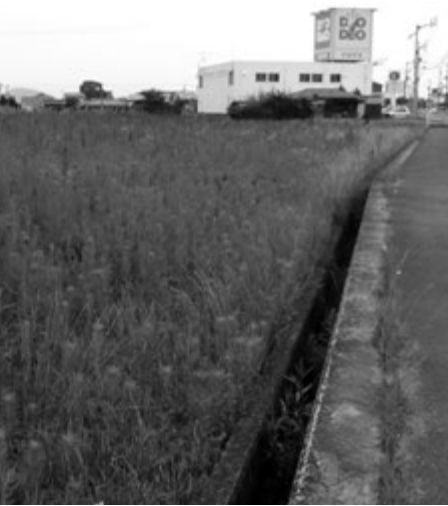
▲県農業試験場三木分場跡地