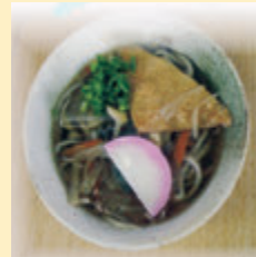
▲自慢の手打ち田舎そば

三木町が一望できる高仙山山頂公園へ、ご家族・お友達で一度お越しください。 鳥のさえずり、木々の中を渡ってくる風を体感してみてください！ さんさい茶屋「同心よりお待ちしております。