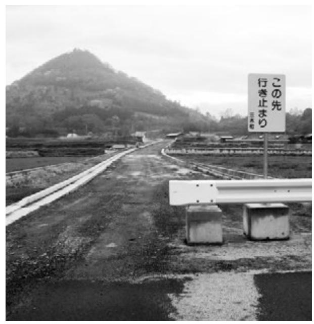
▲用地の交渉が難しい正一駒足線