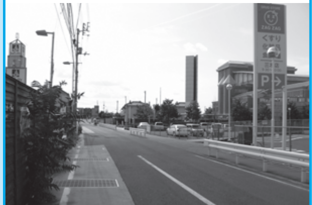
▲ベルシティと文化交流プラザ間の町道

主会場を町中心部に移し、本年10月 27日「獅子たちの里 三木まんで願。」 とし、町をあげての準備が進行中。