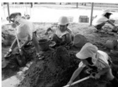
▲水上幼稚園の皆さん

「基本的生活習慣や体づくり」、「人間関係づくり」、「聞く力・話す力づくり」など大きく5つの領域を、これを組み込んだ遊びを通して習得し、後の小学校教育につながることを期待されている。