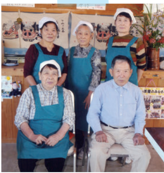
▲気心の知れた仲間と