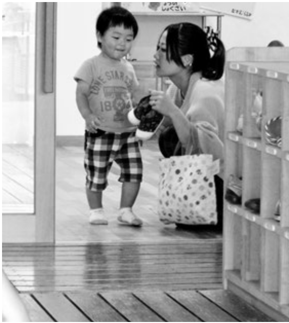
▲働く女性の子育て支援の充実を

事業により、新生児を養育する世帯の経済的な支援や町内事業所の活性化を図っている。ひとり親家庭等に対する医療費の自己負担の撤廃などの子育て支援施策に取り組んでいる。