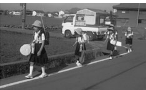
▲通学路の安全対策が待たれる(平木地区・荒木)

今後、警察や道路管理者等と連携して点検し、関係部署に要望するなど通学路の安全確保を鋭意推進して行きたいと考えている。