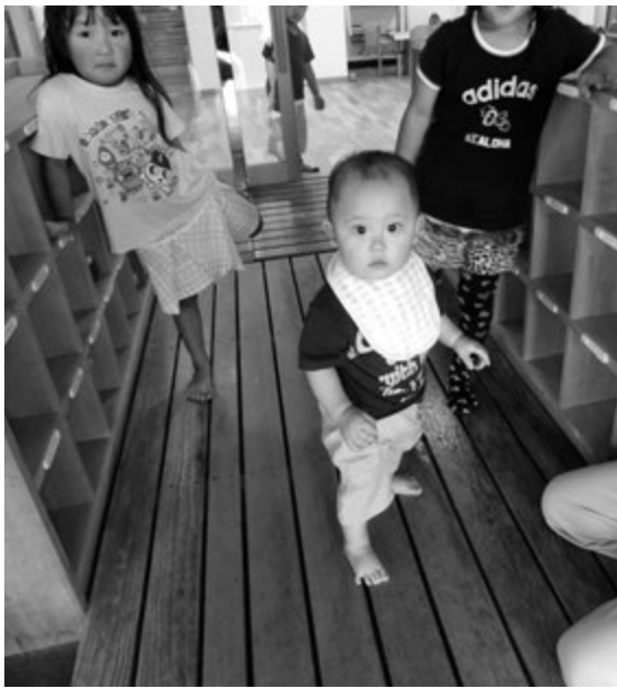
▲未来をにう子どもたち