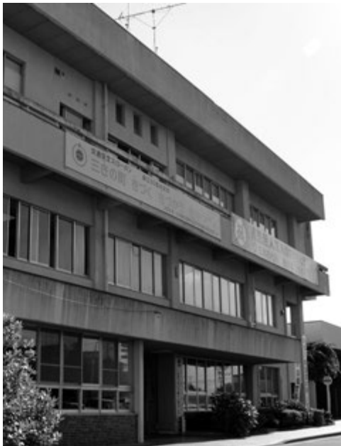
▲耐震補強が必要な福祉センター

で、その内、耐震診断が未実施の施設は1棟だが、この施設については本年度中に実施する予定にしている。