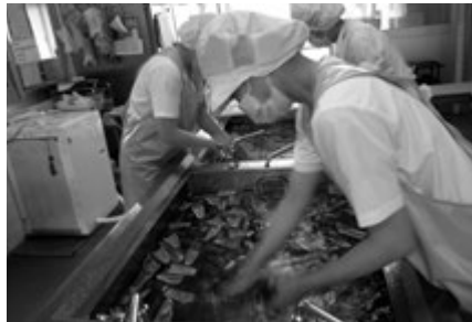
▲一つずつ手洗いされる野菜(平井小)

作業前の衣服の点検、食品納入時の検収担当者による箱・袋の破れや汚れ、品質・鮮度・包装容器等の確認をしている。