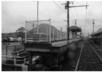
▲中心となる学園通り駅

これまで以上に多くの住民の皆さんにボランティアとして参加・協力をいただき、楽しみながら祭りを盛り上げていきたい。町職員には、その先頭に立つよう働きかけている。