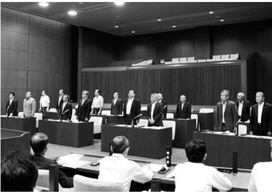
▲本会議採決の様相 (H24.6)