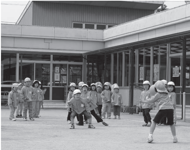
▲子どもの笑顔はまちの宝(平井幼稚園)

町内幼稚園の新体 制づくりが求められて いる現在、三木町独自の「幼稚園型認定こども園」を作り、それを 中核とした新しい町内 幼稚園体制づくりを 目指している。