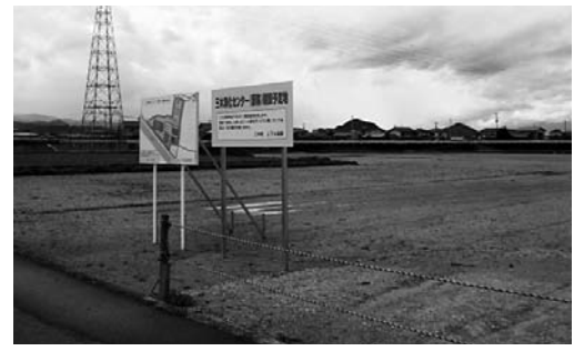
▲公共下水道処理場予定地

農業集落排水事業 三木東地区の計画変 更として、処理人口と 処理区域、および処理 方法を公共下水道へ 接続して処理すること について審議した。 見直し後の人口3 170人、戸数939 戸と減少すること、処 理経費も年10万円程 度有利であることなど が報告され、委員会と して計画変更を了承 した。