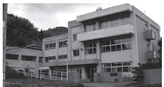
▲廃校となっている神山幼小中学校