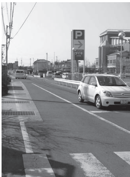
▲ベルシティ・文化交流プラザ間の道路 このストリートで獅子たちの乱舞が