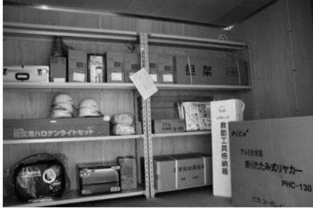
▲文化交流プラザに設置された防災倉庫と庫内資材

基本計画の見直しは、処理方法を膜分離活性汚泥法に変更するとともに、農業集落排水事業三木東地区は、公共下水道に接続し処理する計画に変更する。