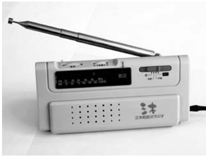
▲屋外放送中継局(上)・防災ラジオ(下)