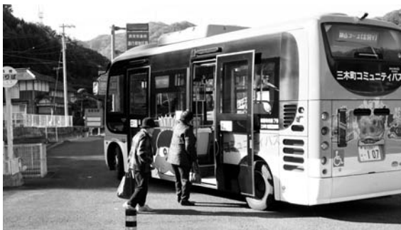
▲子どもがよるこぶ獅子のバス