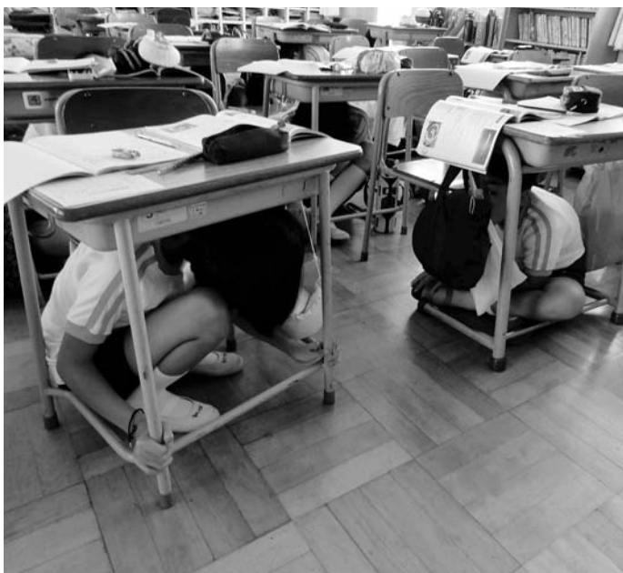
▲もしものための防災訓練(氷上小学校)

学校教育活動中や登下校中に地震に出会ったときの児童生徒の避難行動や保護者への引渡し方法、連絡方法等について保護者と協議して、より実践的なマニュアルを作成している。