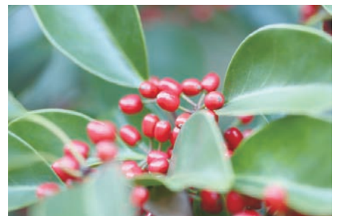
町木:クロガネモチ