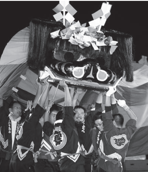
▲ふれあいまつりから新企画にぎわいづくり事業へ (写真:H22ふれあいまつり獅子舞フェスタ)