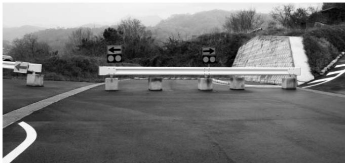
▲開通が待たれる町道正一駒足線