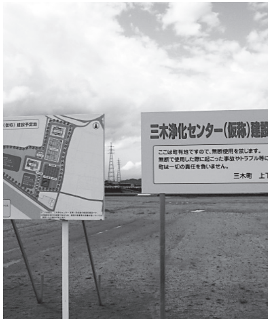
▲処理場予定地に設置された看板