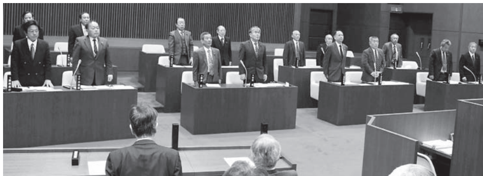
▲本会議採決の様様(H24.3)