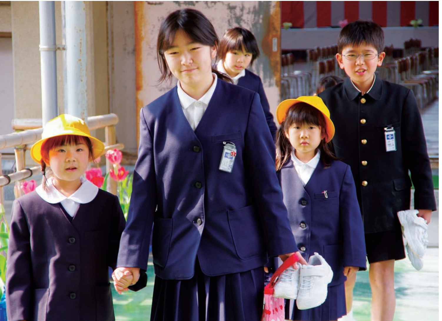
まちにまった入学式(平井小学校)