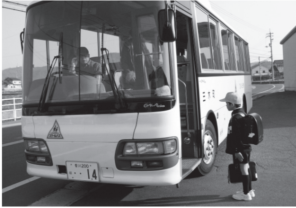
▲スクールバス(平井小学校)

バス会社に委託しているコミュニティバスに617万円。あまりにも格差があるのではないか。