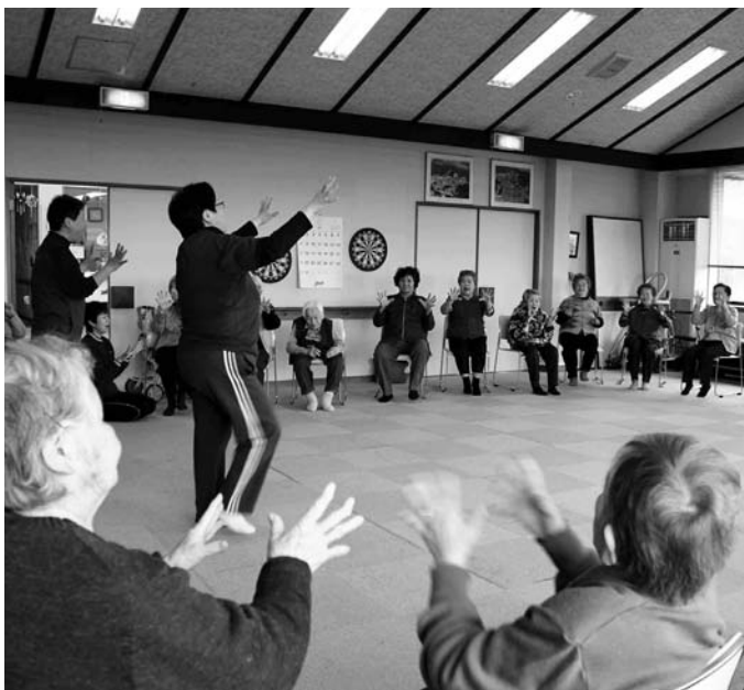
▲デイサービスで今日も元気(あけぼの荘)