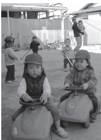
▲氷上保育所1歳児・2歳児の皆さん この子たちの未来が幸せでありますように