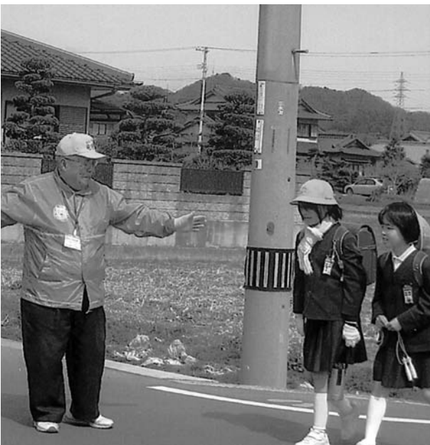
▲見守り隊による交通安全指導（平木・荒木地区）

の指導者を対象とした研修会を開催した。トップアスリートの育成という夢に向かってバックアップしたい。