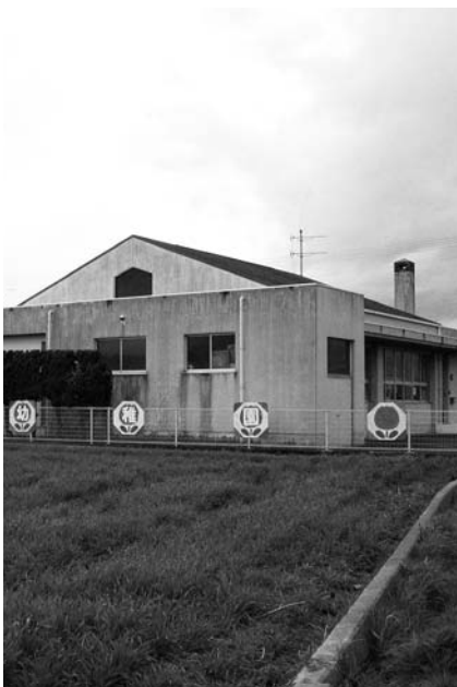
▲田中幼稚園天枝分園