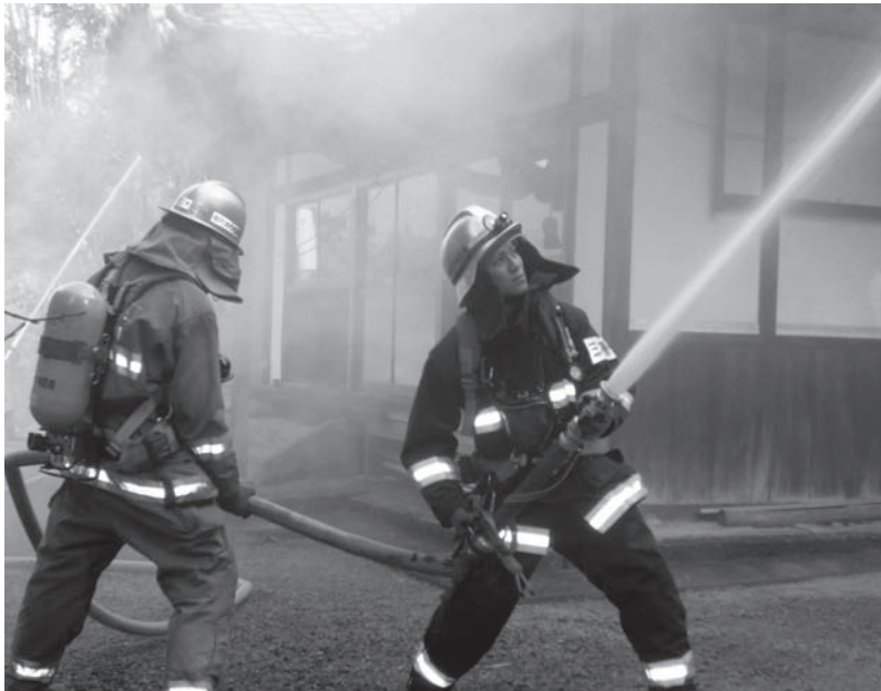
▲もし水がなかったら…