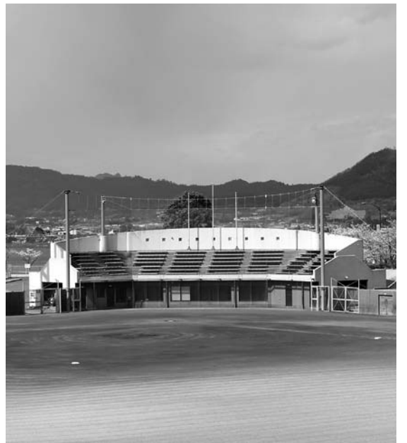
▲屋根が新設される野球場