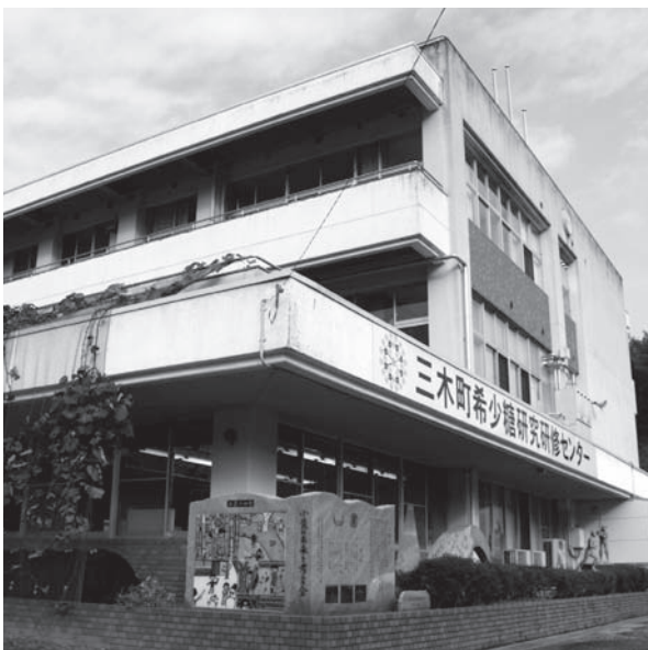
▲希少糖研究研修センター

高齢者対策については、介護が必要になっても住み慣れた地域で、必要なケアを受けながら、価値観や行き方が尊重された自分らしい人生を送ることができるよう支援していく。