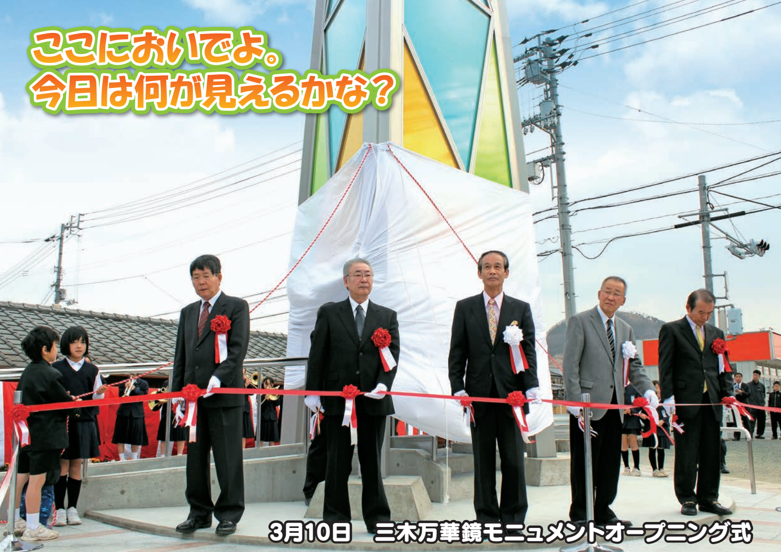
3月10日 三木万華鏡モニュメントオープニング式