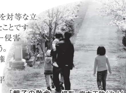
「親子の散歩」

「暴力の防止及び被害者の保護に関する法律」は、平成13年に施行され、平成16年、19年に改正しています。(記:谷本 サクミ)