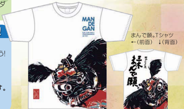
まんで願.Tシャツ ←(前面) ↓(背面)

問い合わせ先 — 「獅子たちの里 三木まんで願。」実行委員会事務局(政策課内) ☎891-3302(内線2214、2215)